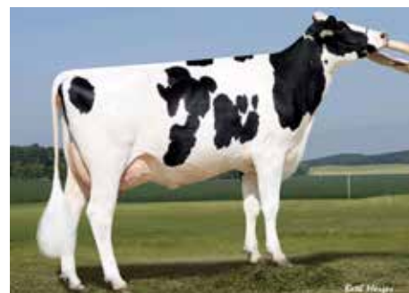
5. Mutter Sandy-Valley IO Amethyst