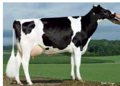
6. Mutter Sandy-Valley Plane Sapphire