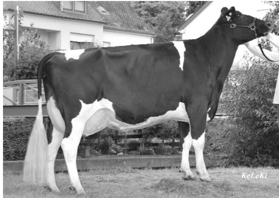
SUPER-CHAMPIONNE der Luxembourg Summer Classics 2008: Lead-Off Tochter Jenifer im Gemeinschaftsbesitz der Betriebe Thein & Elsen, Goebange und SOPRAWA, Rambrouch

war die Vorstellung der Züchtersammlungen aus 7 Zuchtstätten, keine Wünsche offen lasse, beschrieb.