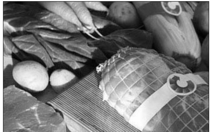
Die Landwirtschaft erzeugt eine Vielzahl an geschmackvollen Lebensmitteln

Der Arzt heilt Krankheit und rettet menschliches Leben. Der Bauer tut keines von beiden. Er unterhält/erhält „lediglich“ das Menschenleben mit denjenigen Nahrungsmitteln, welche die Politik und/oder der Verbraucher ihn unaufhaltsam anreizt oder auffordert, tagtäglich zu erzeugen. Diesem Wunsch und Auftrag sind die europäischen und nordamerikanischen Landwirte nach dem 2. Weltkrieg sowohl quantitativ als auch qualitativ schneller nachgekommen als allgemein erwartet. Mit dem steten Ersetzen der ergiebigen Sonnenenergie durch begrenzte fossile Treib- und Rohstoffe, ob Gespann durch Traktor, Brache durch Kunstdünger, Jäten durch Pflanzenschutzmittel, Handern-