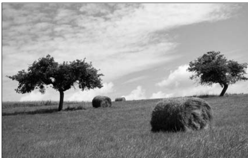
Die grünen Pflanzen bilden die Lebensgrundlage des Menschen

Bei diesen gegebenen Rahmenbedingungen kann die Landwirtschaft nur zusehen und kurz- und mittelfristig nur das tun und produzieren, was dem jeweiligen Familieneinkommen zum gegebenen Zeitpunkt mehr oder weniger