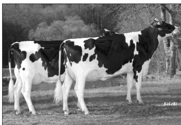
Lonamy-Tochter Vague VG 85 / Boss Iron-Tochter HBL Roxane VG 86; Platz 5 bzw. 11 bei den besten Färsenleistungen; B.: Bosseler Carlo, Limpach